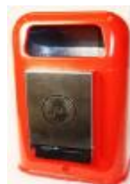
Bsp.: mit Edelstahl-Beutelspender

Zubehör Rohrposten S115 Ø60x2,0x1500mm Spannschloß + 1m Edelstahlband (2 Stk werden benötigt) Rohrschelle Ø60 für Abfallbehälter (2 Stk werden benötigt) Wandhalter (2 Stk werden benötigt) Dreikantschlüssel M5, Kunststoff mit Metalleinsatz