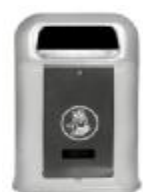
Bsp.: mit Edelstahl-Beutelspender